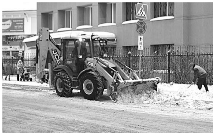
За несколько дней и ночей февраля снег завалил все дороги и тротуары. С этим природным явлением техника МУП «Благоустройство» борется на улице Партизанской.