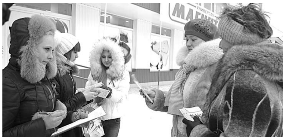
Учащиеся БПТ привлекли внимание богдановичцев к проблеме ВИЧ. Профилактика данного заболевания важна для всех.

Всегда кажется, что проблема нас обойдет. Но на самом деле она рядом. Статистика не утешительна. Свердловская область занимает одно из лидирующих мест в России по зарегистрированным случаям ВИЧ-инфекции. Поэтому проведение этой акции – важное звено в профилактической работе, проводимой в нашем округе.