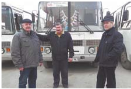
РАСПИСАНИЕ АВТОБУСОВ В ПРАЗДНИЧНЫЕ ДНИ