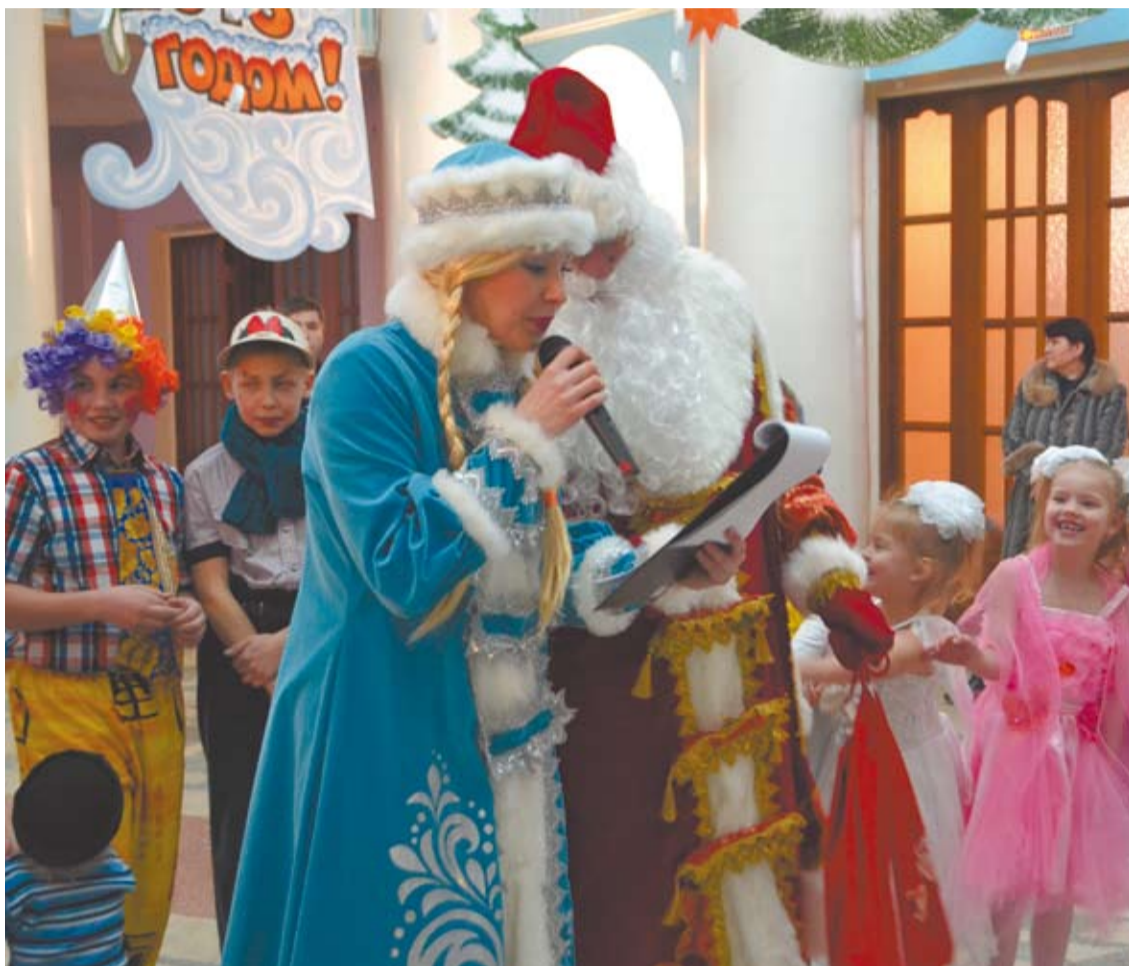
Дети всегда с нетерпением ждут в гости Деда Мороза и Снегурочку. Ведь они приносят с собой волшебство, радость и веселье. А самое главное - подарки.