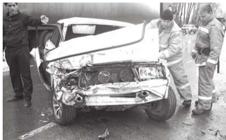
Часто помощь спасателей необходима при серьезных дорожно-транспортных происшествиях.

- Спасателя отличают не только мужество и сила, но и умение побороть свой страх и правильно оценить обстановку. Спасателям приходится часто рисковать. В таких ситуациях он должен думать не только о тех, кого спасает, но и о тех, кто рядом, то есть о своих товарищах, так как в случае ошибки одного могут пострадать многие. Любой