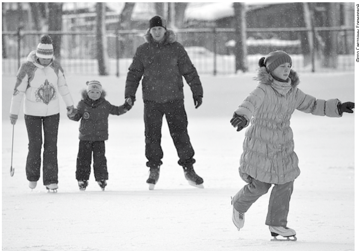
Катание на коньках – это не только приятное, но и полезное времяпрепровождение.