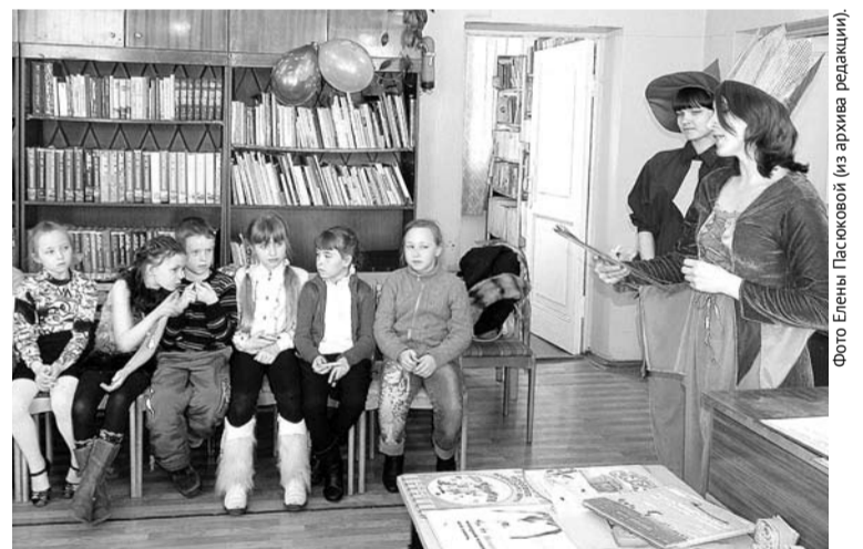
В детской библиотеке проходило много разных мероприятий. Теперь маленькие читатели будут собираться в здании центральной районной библиотеки.

детскому фонду. Надо отметить, что при слиянии книжных фондов может произойти дублирование литературы, так