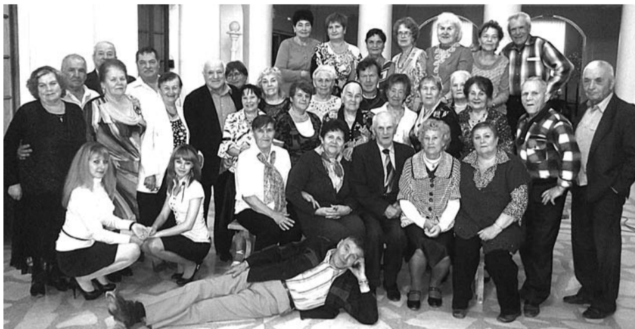
Клубу «Валентина» – 15 лет. И это далеко не последний юбилей, который представители клуба отметят своим дружным и неунывающим коллективом.