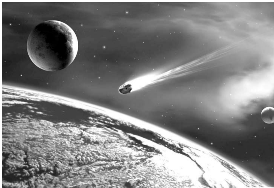
Космическая атака Богданович не задела.