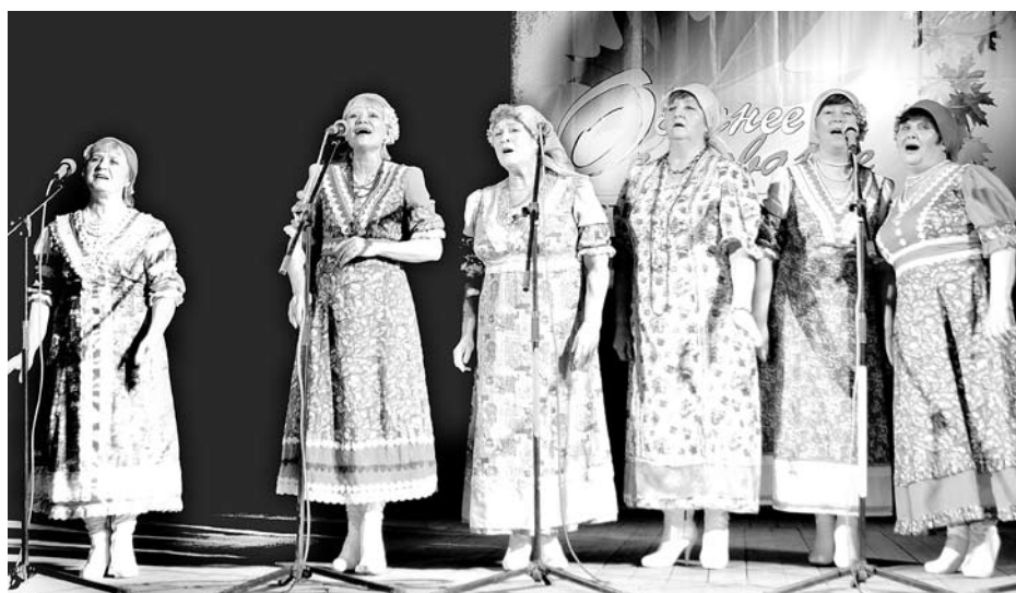
Солистки ансамбля «Селяночка» поют так, что не слушать и не восхищаться ими просто нельзя.