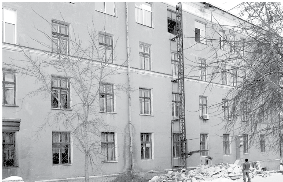
На четвертом этаже главного корпуса ЦРБ заменены окна. К сожалению, сделать снимок, как идет ремонт во внутренних помещениях, нам не разрешили.

Капремонт этих отделений стал возможен, благодаря средствам, выделенным из федерального и областного бюджетов. Всего на ремонт от-