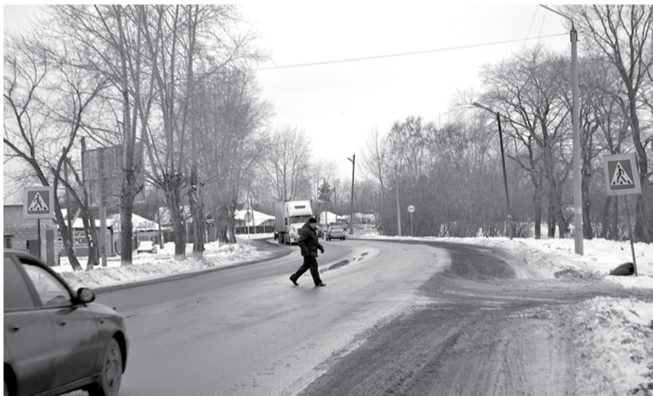
Для безопасности пешеходов вдоль всей улицы Кунавина оборудовано несколько пешеходных переходов, но даже пересекая улицу по правилам, нужно убедиться, что автомобили тебя пропускают.

довольно сложно. Вот люди и подвергают себя опасности, переходя дорогу в темноте. А почему бы каким-то особым образом дополнительно не сделать акцент на этих участках? Может быть, поставить мигающие светофоры или установить дополнительные знаки на желтом фоне, которые бы были видны издали...»