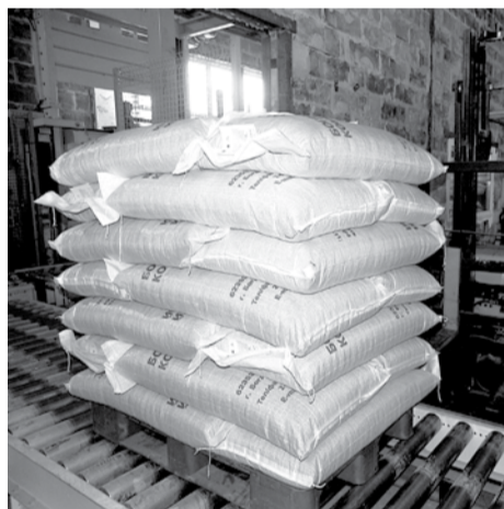
Поддоны с автоматически наполненными, зашитыми и уложенными мешками комбикормов сами выкатываются к автопогрузчику.