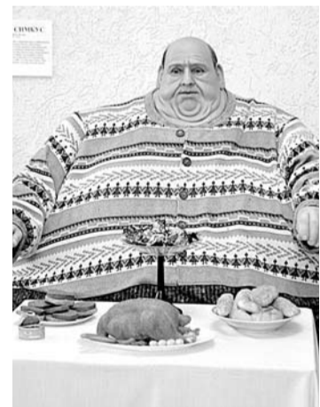
Самый толстый в мире человек - один из главных героев выставки.