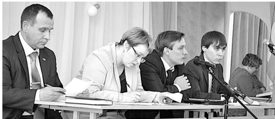
Представители администрации ГО Богданович внимательно слушали вопросы собравшихся и отвечали на каждый из них.