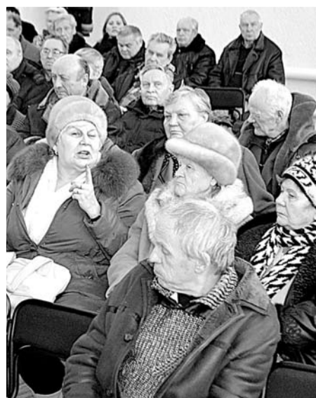
Из зала поступило много вопросов.

Тем не менее администрации удалось сохранить свое участие во всех целевых программах, в которые она была включена еще в 2011 году. Были отремонтированы пять придомовых территорий, пять дворовых проездов, проведен текущий ремонт проезжей части улиц Октябрьской, Первомайской и 8 Марта. В котельной Барабы были заменены котлы, отремонтирована Байновская котельная, переданная на баланс муниципалитета, пущен газ в Ильинском, в том числе газифицированы и объекты социальной сферы. Были продолжены работы по газификации Троицкого, Чернокоровского, Тыгиша и Богдановича. МУП «БТС» с прошлого года осуществляет эксплуатацию всех котельных городского округа, за исключением котельной ОАО «Огнеупоры». Часть котельных досталась муниципалитету в «аховом» состоянии, но они были