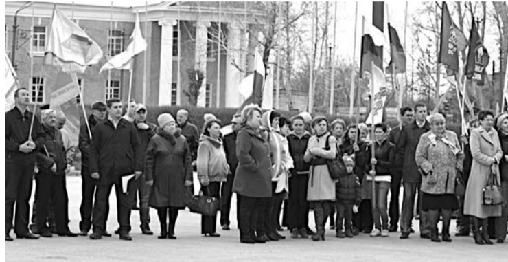
На праздничном митинге собрались представители разных партий. В этот день они вместе выступили за трудовую справедливость.

тий - «Единая Россия» и ее «Справедливая Россия», «Молодая гвардия», КПРФ, члены общественных ор-