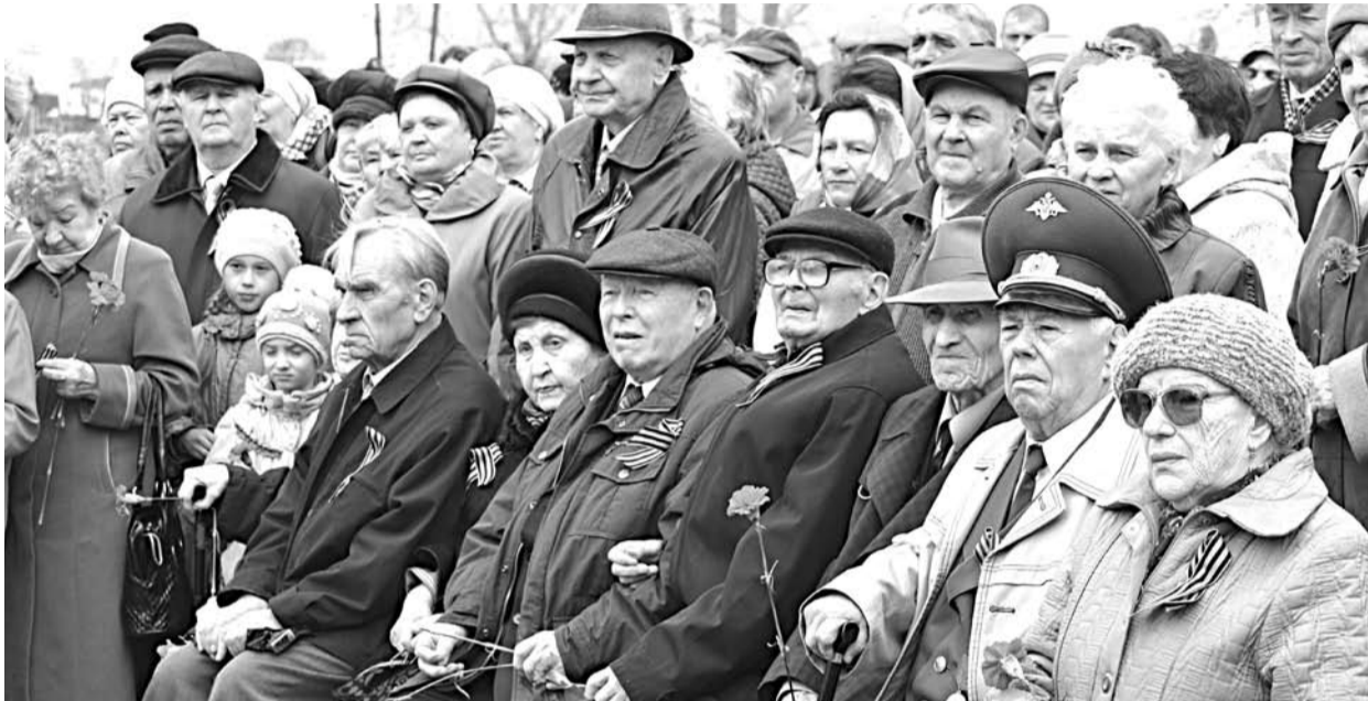
На открытии мемориальной доски в честь 70-летия Уральского добровольческого танкового корпуса, состоявшемся 6 мая 2013 года в Грязновском, среди почетных гостей были ветераны Великой Отечественной войны.

Апрель и май по традиции ассоциируются у нас с пробуждением природы, теплом, Пасхой и субботниками. Безусловно, май - месяц чествования ветеранов. Именно защитники Родины, отстоявшие родную землю, подарили нам, их потомкам, мирное небо над головой.