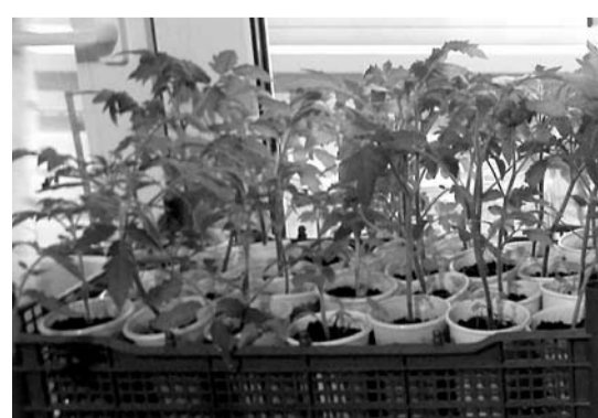
Верной приметой весны являются горшки с рассадой на всех подоконниках.