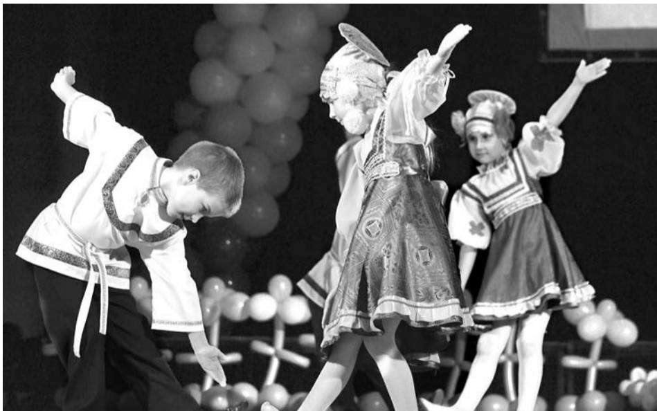
Фестиваль детского творчества «Весенняя капель», который ежегодно проходит в Богдановиче в начале апреля, также оповещает о начале весны.