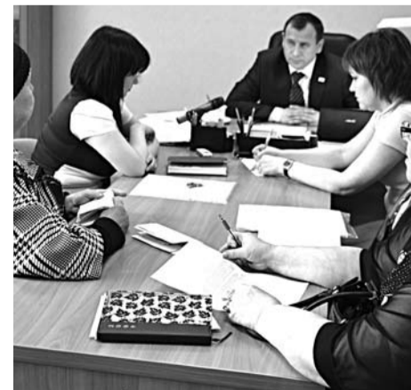
Одной из мер погашения задолженностей является вызов неплательщиков на комиссию по взысканию долгов по оплате за ЖКУ.

Первый из них накопил задолженность в сумме 69600 рублей; вторая - аж 75750 рублей. Причем оба живут в благоустроенных квартирах и пользуются всеми благами цивилизации за счет своих добросовестных соседей. В ходе разбирательства оба были предупреждены о необходимости оплаты долгов, и для начала - заключения договора об их погашении с управляющей компанией. Если в течение недели должники этого не сделают, будет поставлен вопрос о переселении их в общежитие или о расторжении договора социального найма.