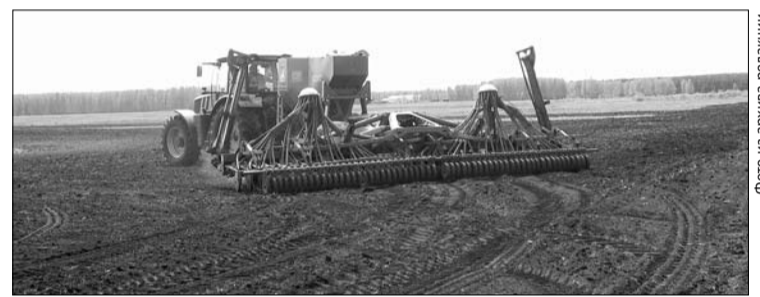
На поля района вышли современные посевные комплексы.

По состоянию на 6 мая, в нашем городском округе уже засеяны 1554 гектара пашни, это почти пять процентов от общей площади ярового сева. Лидером пока является крестьянское хозяйство Петра Кузнецова, где уже посеяно 730 гектаров, из которых 700 гектаров – зерновые культуры.