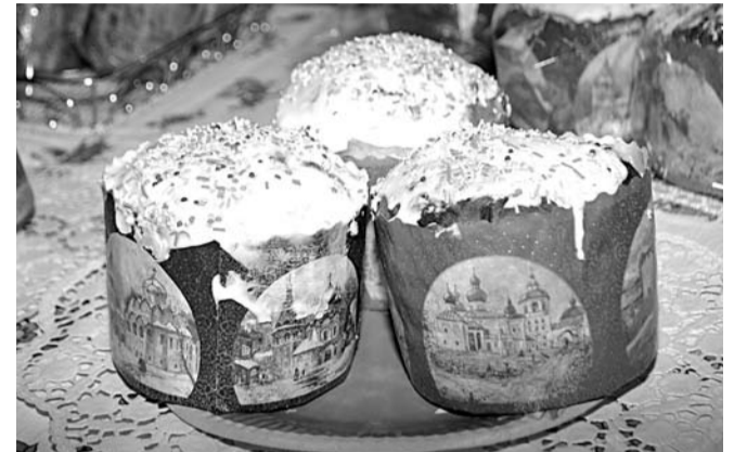
Символ великого светлого праздника Пасхи - куличи, которые в этот день украшают стол каждой православной семьи.

Как прекрасно природы рождение: Неба синь, зелень ранней листвы... Георгий Копалейшвили.