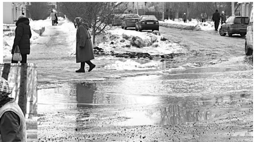
После нынешней снежной затяжной зимы наступила «разлившаяся» по всему городу зыбкая весна.

В традиционном весеннем субботнике принимали участие предприятия и организации ГО Богданович. На снимке: на уборке территории парка Дружбы задействованы сотрудники администрации нашего городского округа.