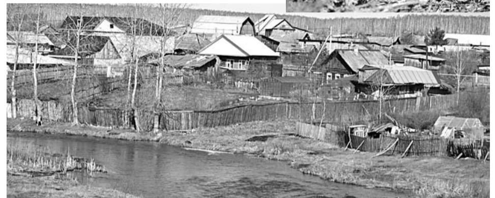
Половодье нас обошло стороной.