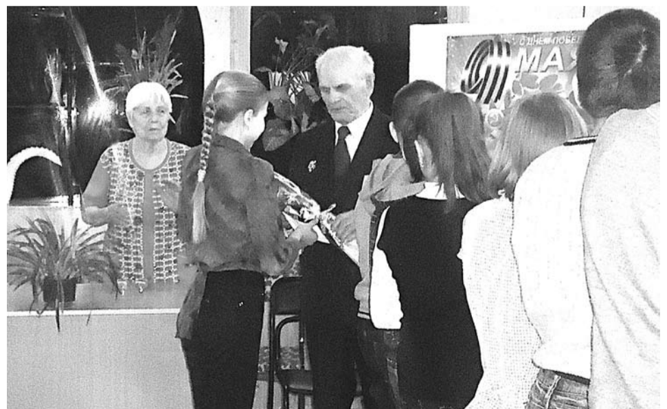
Учащиеся 5-а класса школы N 1 поздравили ветеранов с наступающим Днем Победы, поблагодарили их за мужество и стойкость, проявленные в годы Великой Отечественной войны.