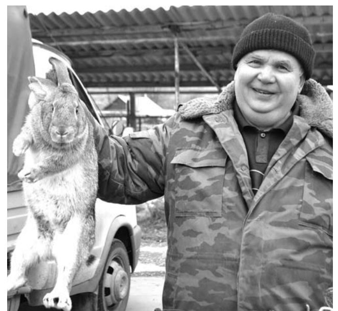
Традиционные сельскохозяйственные ярмарки, проходящие в Богдановиче весной и осенью, заманивают покупателей низкими ценами и разнообразными товарами, в том числе домашней живностью.