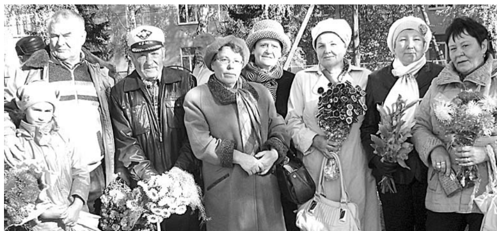
Группа «маяковцев» (г. Богданович) приехала в п. Б. Брусяны, чтобы почтить память пострадавших от аварии на ПО «Маяк».

зею ПО «Маяк», мы посмотрели документальный фильм об этой страшной аварии. Кроме того, была организована обзорная экскурсия по Озерску, наша делегация возложила цветы к памятнику известному ученому Игорю Кур-