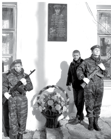
Мемориальная доска на фасаде Полдневской школы - дань памяти герою.