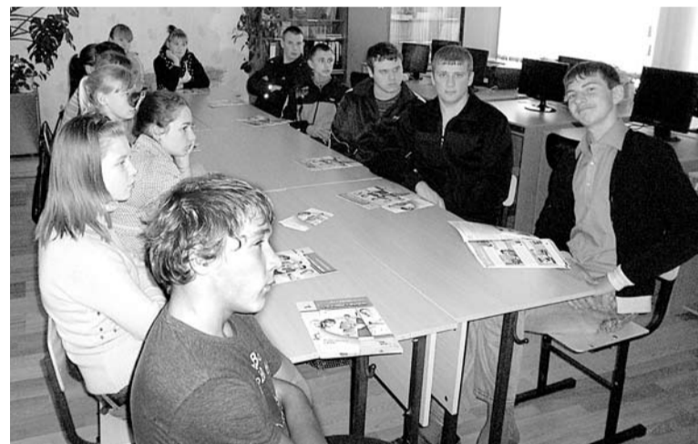
Тыгишские старшеклассники с интересом слушали лекции о будущей пенсии.

Управление Пенсионного фонда РФ в г. Богдановиче.