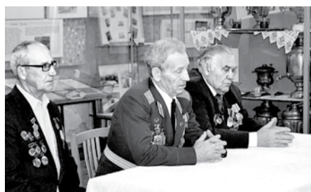
ПОЧЕТНЫЕ ГРАЖДАНЕ ПОВСТРЕЧАЛИСЬ СО СТАРШЕКЛАССНИКАМИ