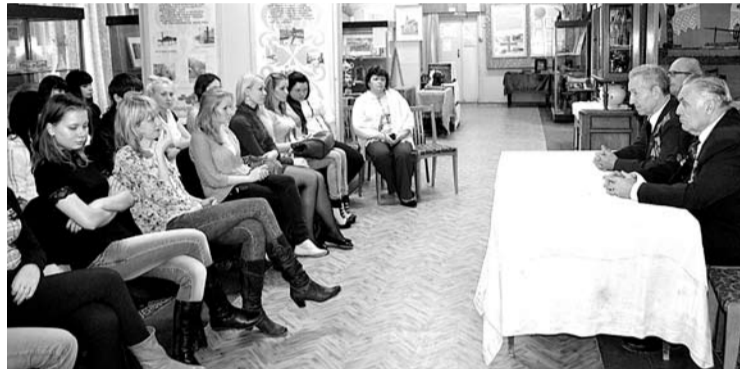
От выбора профессии зависит будущее. Почетные граждане ГО Богданович советовали школьникам сделать правильный выбор.

В КРАЕВЕДЧЕСКОМ музее прошла встреча почетных граждан со старшеклассниками школы №3. На встрече два поколения обсудили вопрос, как выбрать профессию.