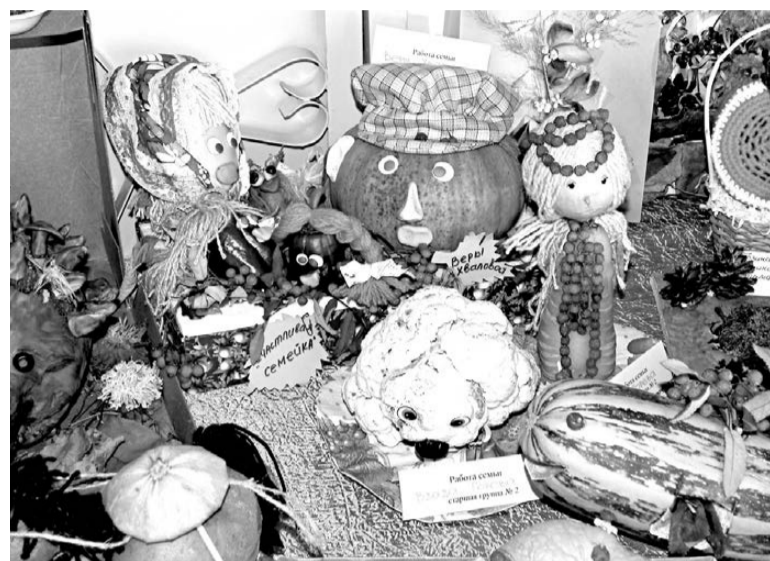
Все экспонаты выставки были настолько разнообразными, что выбрать из них лучшие оказалось проблематично.