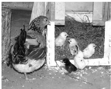
МИНИ-ЗООПАРК НА «СЕВЕРЕ» ГОРОДА