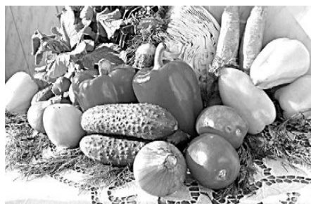
БОГДАНОВИЦЕВ ПОРАДОВАЛ УРОЖАЙ