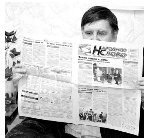
«Народное слово» – самая читаемая газета.