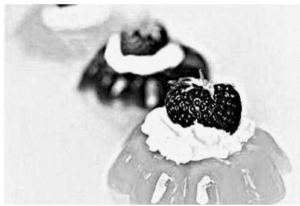
ОПАСНЫЙ ЖЕЛАТИН ЗАВЕЗЛИ ИЗ КИТАЯ