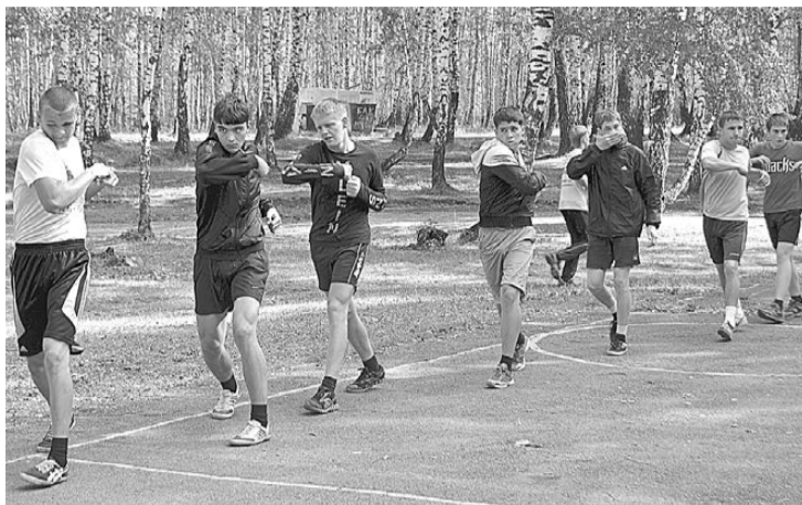
У воспитанников отделения бокса каждая тренировка начинается с разминки.

– В спортивном лагере наши воспитанники не только хорошо проводят время, общаясь друг с другом и отдыхая, они еще и усиленно занимаются, – рассказывает один из