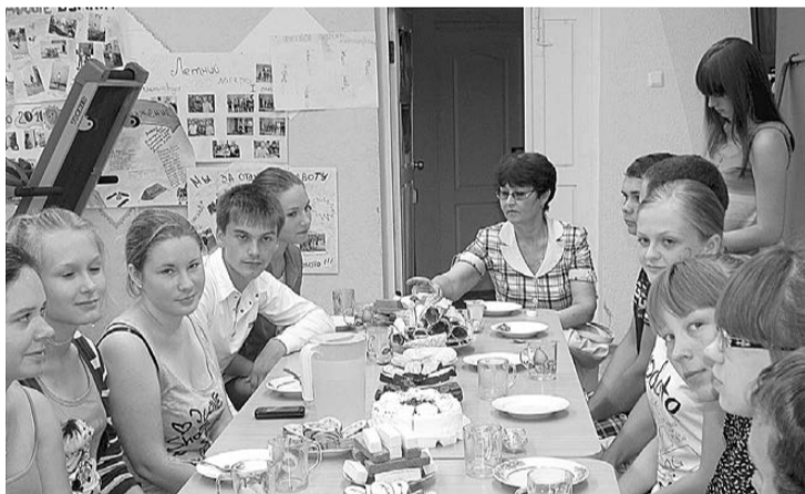
Ребята из «ЖКХ-Юниор» устроили праздничное чаепитие по случаю окончания второй трудовой смены.

Члены клуба охотно поддержали эту идею, поскольку команда по этой игре у них уже создана, ребята сами расчистили для нее площадку и «режут» в лапту с утра и до вечера с не-