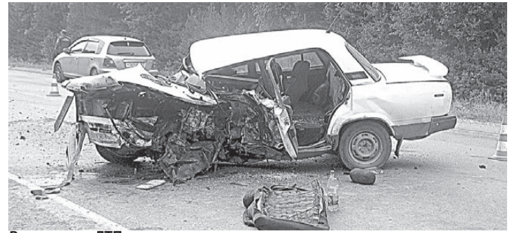
В результате ДТП от «пятерки» осталась куча железа.

От удара «пятерку» развернуло, и она столкнулась с «Hyundai Accent». В результате ДТП у водителя