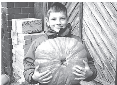
ПОДВЕДЕНЫ ИТОГИ ОЧЕРЕДНОГО КОНКУРСА «НС»