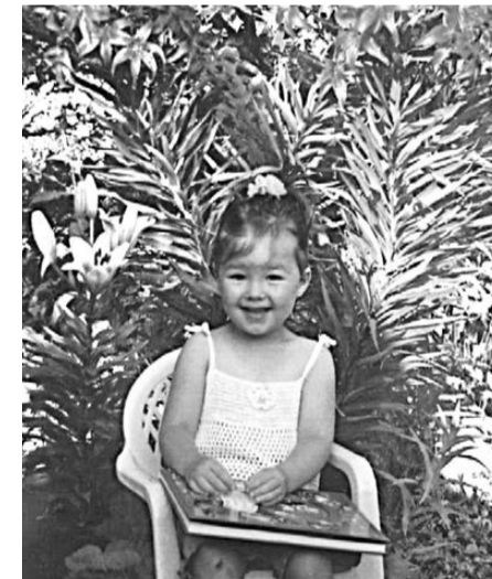
Сонечка – самый красивый цветок сада бабушки. Фото Веры Аптиной, с. Ильинское.