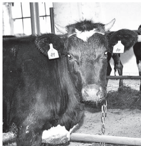
В корпусе содержится около 200 голов племенных телок и нетелей.

держатся 755 голов скота, в том числе 340 коров. Сельхозпредприятие обрабатывает 1809 га пашни, в том числе зерновых – 700 га, средняя урожайность зерновых нынче составила 14,9 ц с гектара. Общий объем навоза за 9 месяцев текущего года – 1145 тонн. В хозяйстве трудятся более 40 человек.