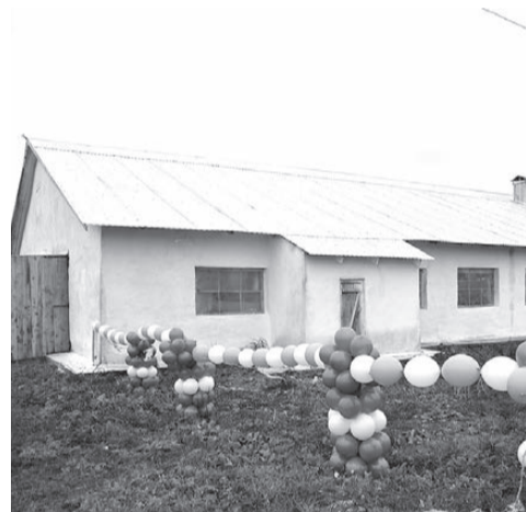
Новый корпус пришлось восстанавливать практически с нуля.

дующий, шестой по счету, корпус. В нем будут содержаться бычки. Не исключают в хозяйстве и возможности ввода в эксплуатацию собственного молочного завода и мясокомбината. Пуск первого запланирован на 2013 год, второго – на 2014, конечно, если все сложится благополучно.