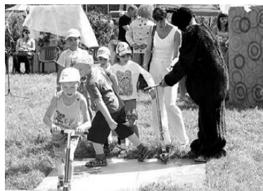
ОГНЕУПОРЩИКИ ДАРЯТ ГОРОДУ ПРАЗДНИК