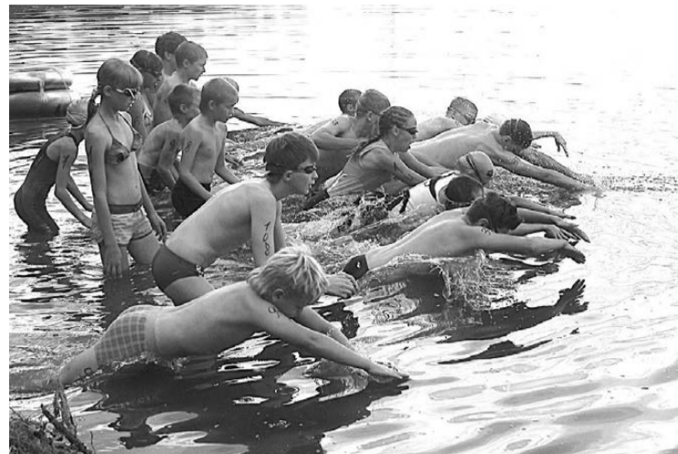
Плавание - первый этап дистанции. Стартуют участники 1998-2000 г.р., а также 2001 г.р. и младше.

Этапы Кубка области и Кубка России по триатлону не оставили