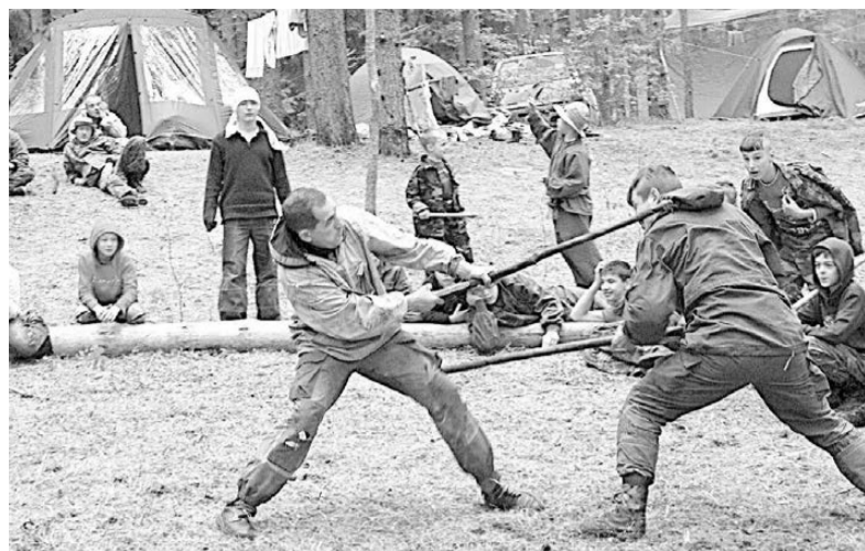
На Бузе мужчины мерялись силой в турнире на тростках.

Настоящее раздолье было и для мальчишек, отцы которых взяли их с собой. За «Карандашами» (так назывался мальчицкий отряд) был закреплён опытный дядька, научивший их метанию