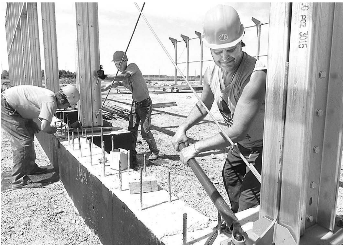
Рядом с существующими корпусами СК «Уральский» ведут работы по увеличению площадей предприятия.