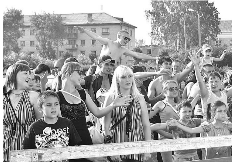
Молодежь на своем празднике отрывалась на всю катушку.

После изрядной порции концертных номеров и конкурсов «СТИМУЛ» организовал для всех