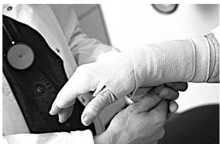
В БОГДАНОВИЧЕ ПЛАНИРУЮТ ОТКРЫТЬ ТРАВМОЦЕНТР