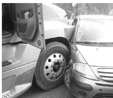
Фото с места происшествия 21 июля. Вот что бывает, когда автомобиль выскакивает на «встречку».

Наталья ДЕМИНА, инспектор по пропаганде ОГИБДД.