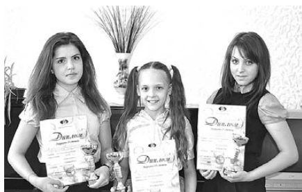
ВОСПИТАНИЦЫ ДШИ СТАЛИ ЛАУРЕАТАМИ МЕЖДУНАРОДНОГО КОНКУРСА