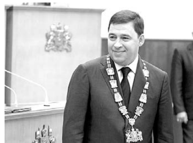
Евгений Владимирович Куйвашев.

Департамент информационной политики губернатора Свердловской области.