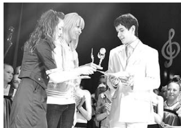
ФЕСТИВАЛЬ «УСПЕХ» СОБРАЛ ЮНЫХ АРТИСТОВ БОГДАНОВИЧА