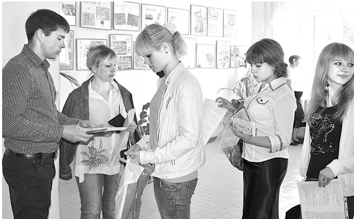
Перед ЕГЭ в пункте проведения экзаменов (школа №3) ученики 11 классов проходят регистрацию.

В школе №3 28 мая итоговую аттестацию проходили выпускники всех школ, прикрепленных