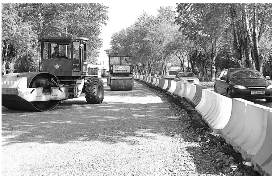
Катки Богдановичского ДРСУч укатывают щебень у центрального стадиона.