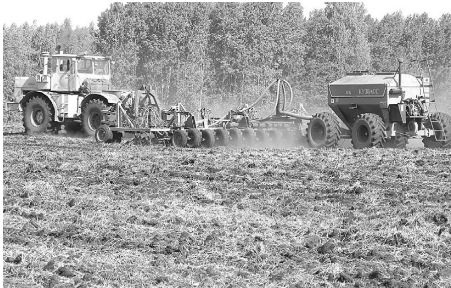
Посевной комплекс «Кузбасс» ООО «БМК» завершает сев пшеницы.