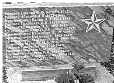
На обелиске в с. Верхняя Колыбелька увековечены фамилии павших в войну богдановичцев.