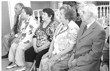
38 СЕМЕЙНЫХ ПАР БОГДАНОВИЧА ПООЩРЕННЫ ЗА КРЕПКИЙ БРАК