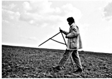
УВЕЛИЧИТСЯ НАЛОГ НА ЗЕМЛЮ СТР. 2.