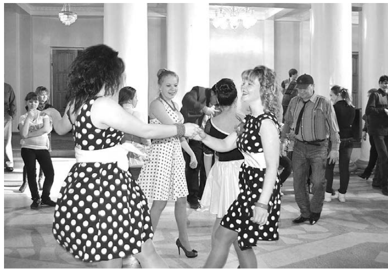
Рок-н-ролл увлек молодежь в годы ярких красок, заставив не только танцевать, но и превратиться в настоящих стильяг.

Праздник начался в фойе. Здесь играл саксофон, проходила фотосессия, работало кафе. Игра саксофониста иногда прерывалась зажигательным рок-н-роллом, под который невозможно было устоять на месте... А никто и не стоял, почти все танцевали.