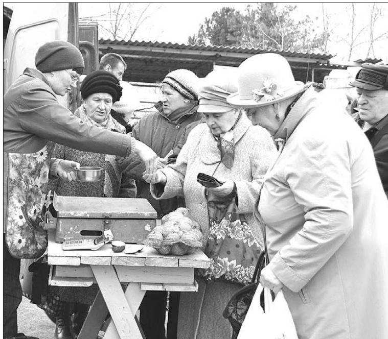
Торговлю овощами и картофелем ведет КХ «ИП Жигалов А.В.».

Среди первых на ярмарке наибольшие площади традиционно заняли крупнейшие хозяйства нашего городского округа: СПК