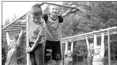
Начался прием заявлений в летние лагеря Стр. 3