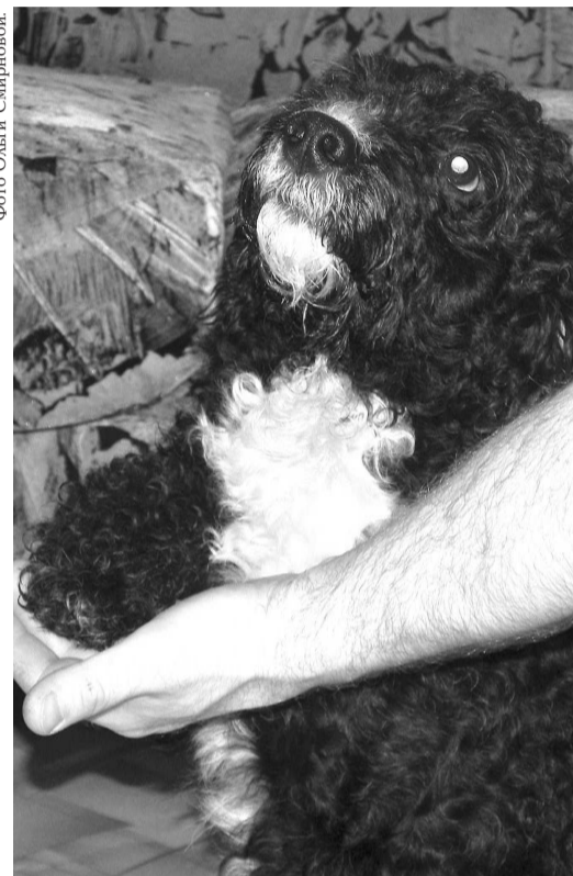
...и они нам платят взаимностью.