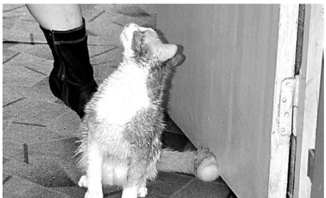
Мы в ответе за тех, кого приручили...