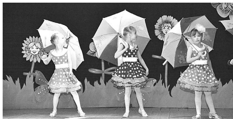
На сцене воспитанники детского сада «Ивушка».