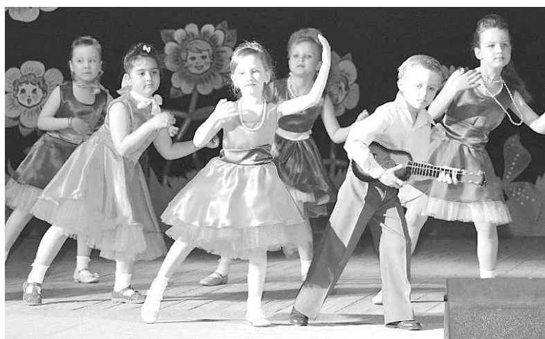
Выступает коллектив «Почемучки».