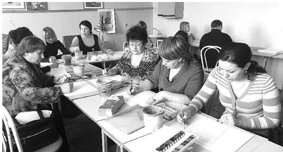
Идет мастер-класс по печатной графике.