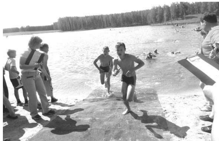
После плавания участники бегут на второй этап дистанции — езда на велосипеде.