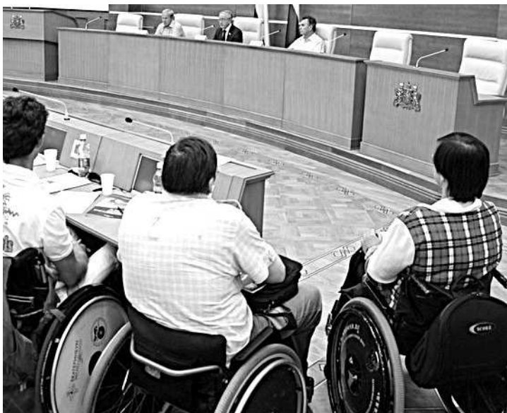
Колясочники попросили депутатов обеспечить им выход из дома.

Большая часть «колясочников», а это более двух тысяч человек, вынуждены сидеть дома, потому что каждый выход на улицу для них становится стрессом. Подъезды не приспособлены, лестничные пролеты узкие, нет поручней, ступеньки крыльца высокие и скользкие.