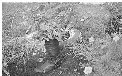
Прохожих привлекает не столько разнообразие красок на клумбе, сколько оригинальность ее оформления.

Бархатцы, петунии, декоративные подсолнухи, астры, окаймленные фиалками, которые распускаются по ночам и издают чудесный аромат... Каких цветов здесь только нет. Да и украшены клумбы Окончание на 2-й стр.