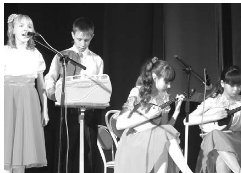
Вокально-инструментальный ансамбль «Акварель».