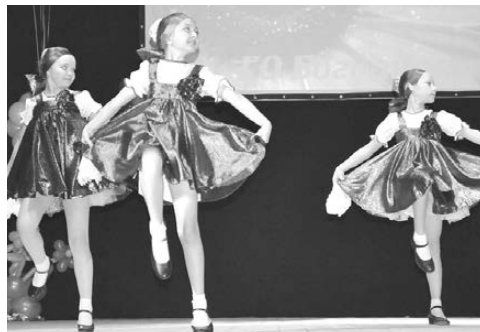
Хореографический коллектив «PRO-движение».