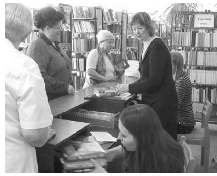
В библиотеке всегда рады читателям.

Уважаемые работники культуры! Сердечно поздравляем вас с профессиональным праздником - Днем работника культуры!