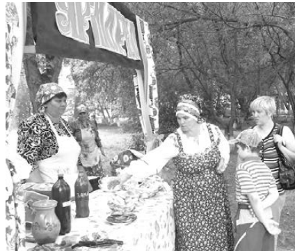
Чернокоровский ДК на Дне города.