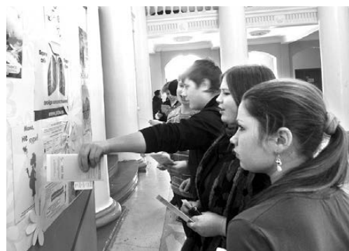
Ребята с интересом читали материалы, посвященные борьбе с туберкулезом.