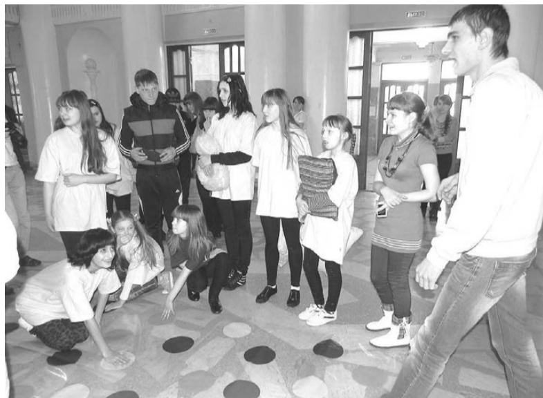
Забавная игра «Твистер» развеселила молодежь.