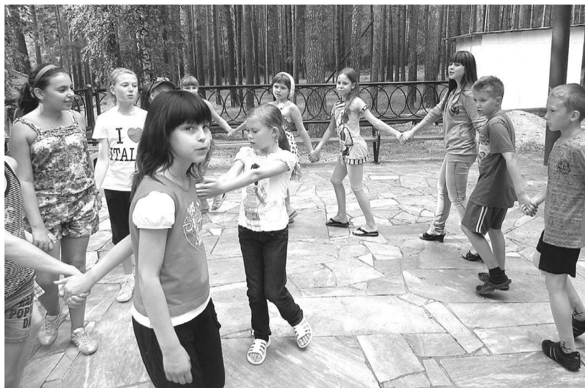
В санатории «Колосок» летом прошлого года отдохнуло 196 богдановичский ребят.

Известно уже объемы финансирования нынешней летней оздоровительной кампании. На наш округ