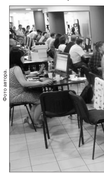
* Журналисты слушали выступление Владимира Путина в пресс-центре.

Сейчас разрабатывается комплексная программа модернизации Уралвагонзавода объемом около 55 миллиардов рублей, - рассказал Владимир Путин. - Она должна быть принята в конце текущего года. Для предприятия, для трудового коллектива появилась четкая перспектива