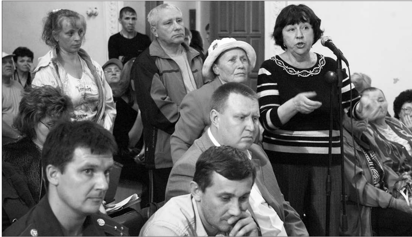
* К микрофону выстроилась очередь, когда приступили к обсуждению проблем ЖКХ.