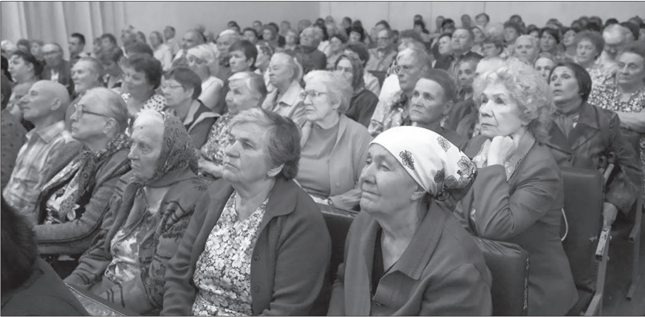
* Жители поселка возлагают на встречу с главой большие надежды.