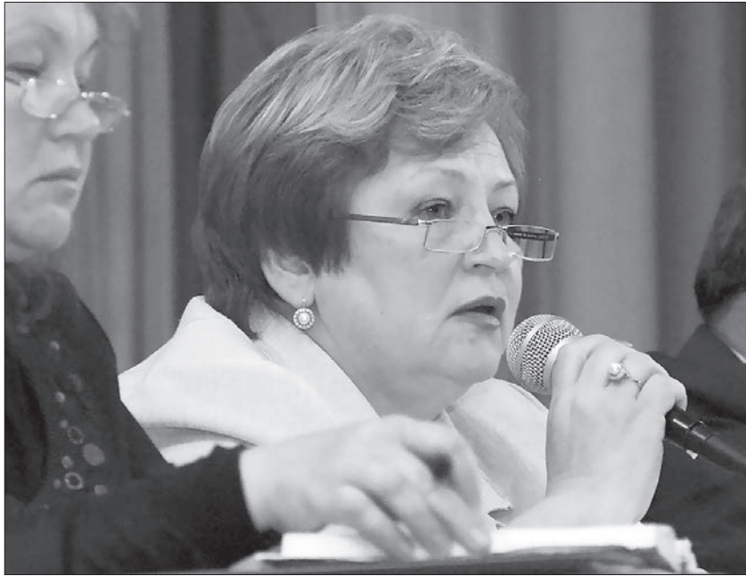
* Глава города отвечает на вопросы жителей Рудника.