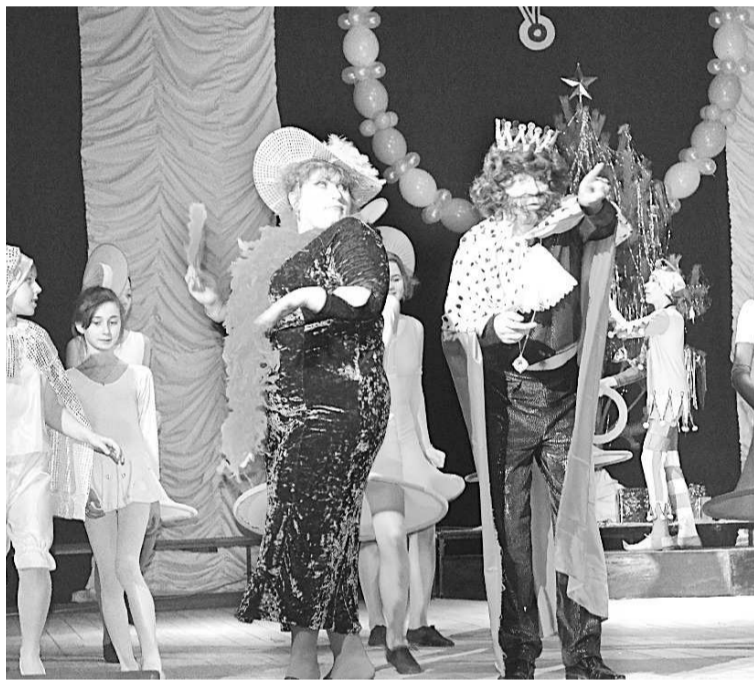
Забавный король и злая мачеха развлекали детей своими шутками.