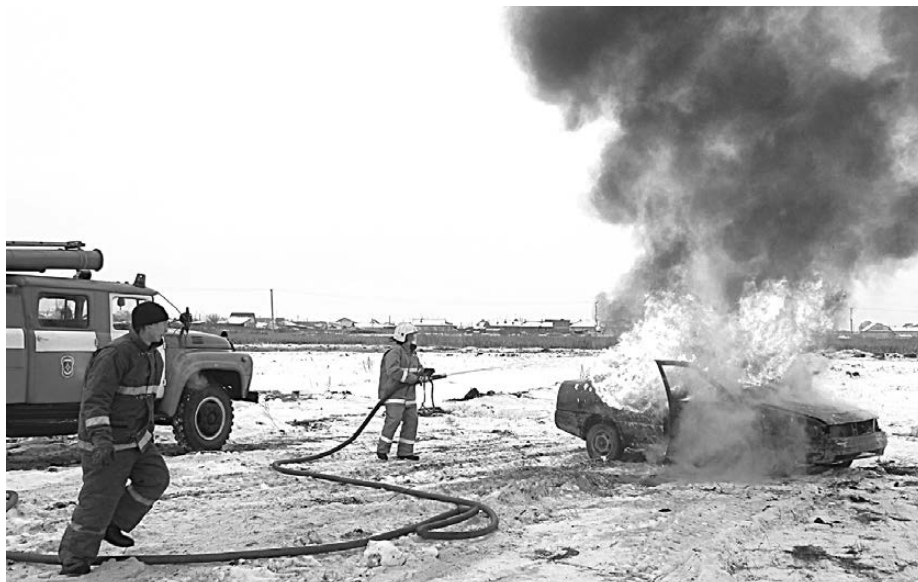
Спасатель должен быть готов к любой чрезвычайной ситуации.