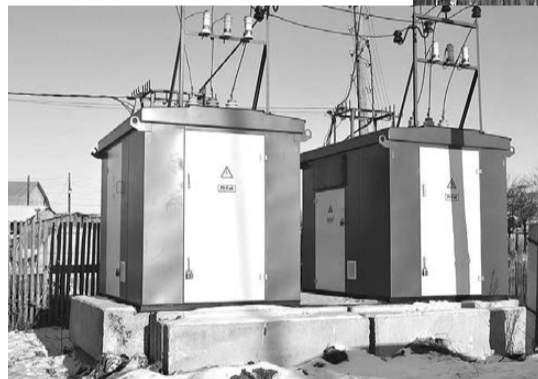
Новая двойная ТП на улице Бажова.