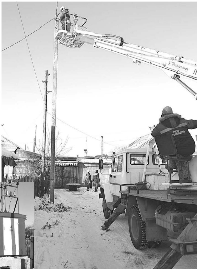
Идет замена линии электропередач на улице Пургина.