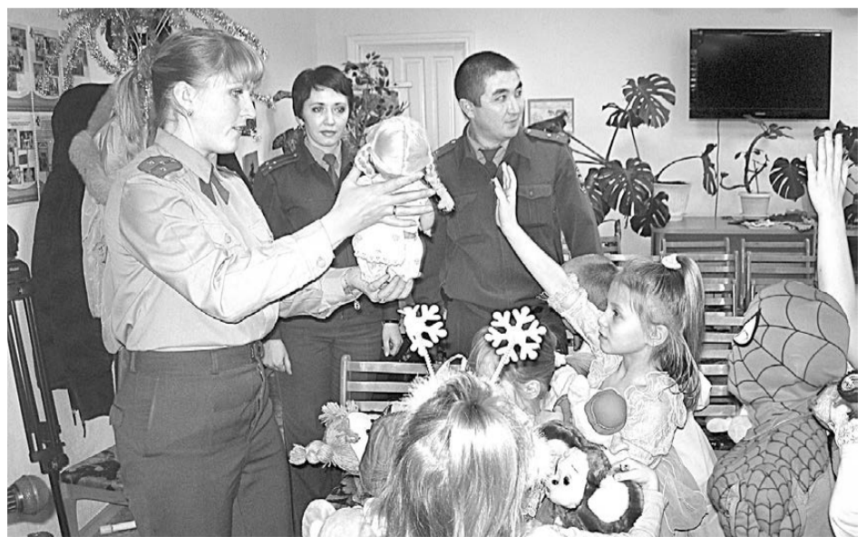
Дети с большой радостью получали подарки от сотрудников полиции.