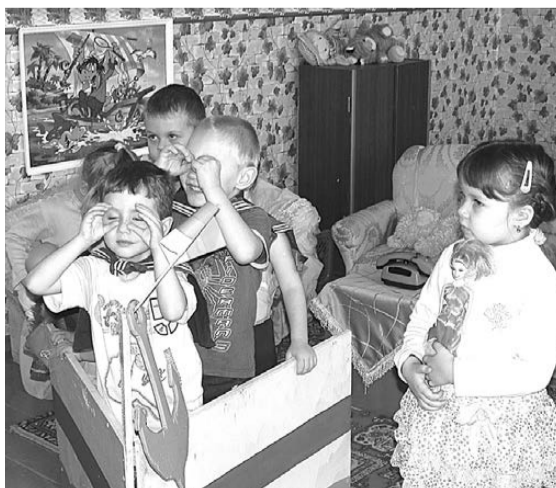
В средней группе детского сада «Солнышко».