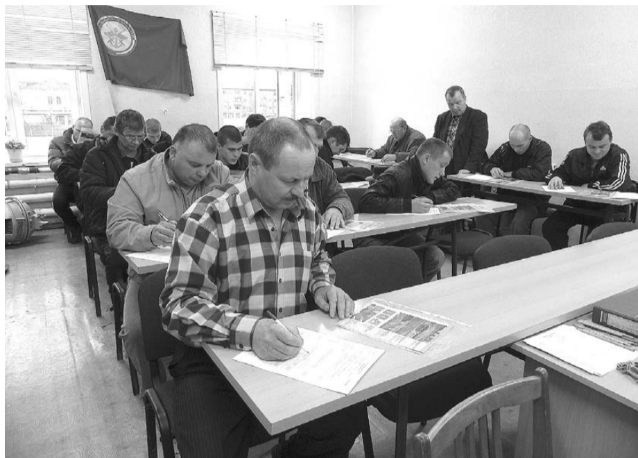
Водители предприятий АПК проходят первый этап конкурса.