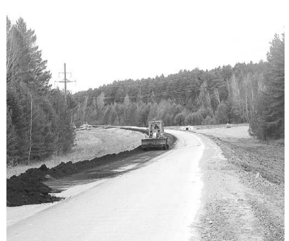
Заканчивается ремонт дороги в Кунарское.