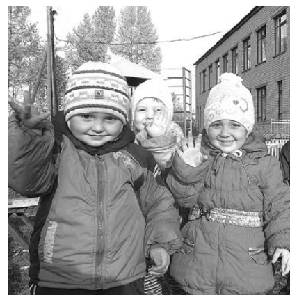
Малыши в садике не скучают.

Но и молодыми кадрами коллектив пополняется. За последние два года устроились на работу три молодых специалиста.