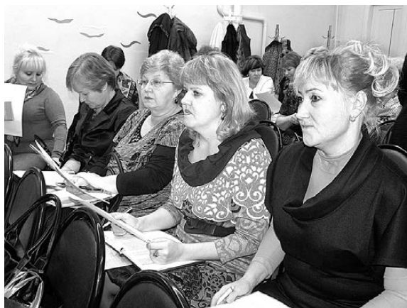
Заведующие детскими садами и директора школ были ознакомлены с итогами проверок.

Во-первых, учреждениям образования следует проверить на соответствие СанПиНу питьевые фонтанчики, установленные для организации питьевого режима школьников. Во-вторых, внимательней относиться к приемке товара: сразу выявлять случаи поставки недоброкачественной продукции, а, принимая товар, складывать его на подтоварники, а не на пол. Соблюдать товарное соседство, это, в-третьих. То есть, к примеру, там, где хранится хлеб, больше ничего не должно лежать. Были названы и другие выявленные нарушения.