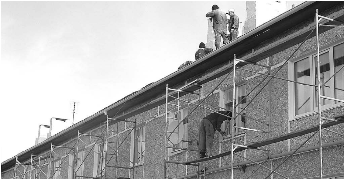
Пять из семи многоквартирных домов Коменок ремонтируются сегодня.

— К сожалению, численность поголовья скота год от года уменьшается. Наверное, сказывается близость села к городу. Но коров сельчане все же держат. Сегодня на территории насчитывается 52 головы крупного рогатого скота, в том числе 22 коровы (для сравнения: в 2009 году