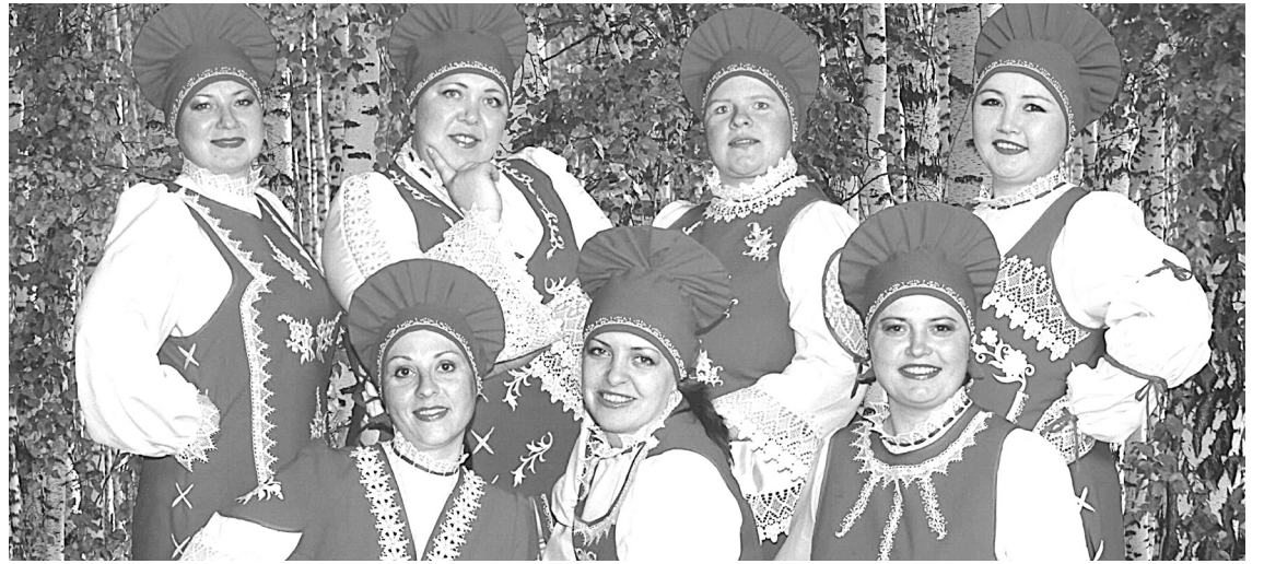
Ансамбль народной песни «Любава».