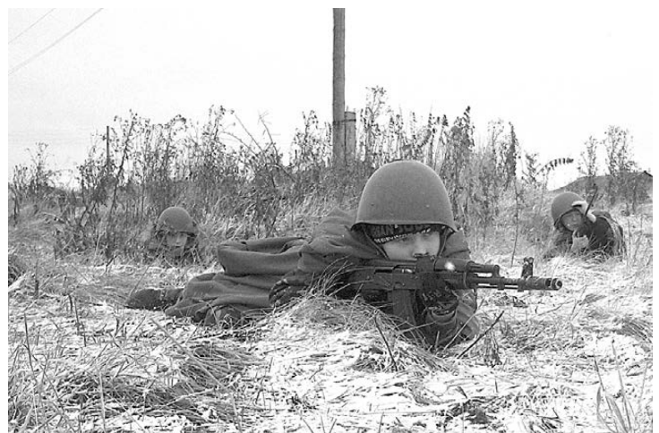
Казачата на полевой игре «Пластун».

С ребятами занимались учителя Ильинской школы. Они провели мастер-класс «Русская изба», в ходе которого дети собственными руками изготовили макеты изб;