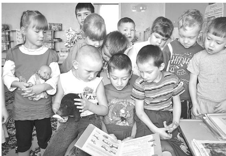
Старшая подготовительная группа детского сада.