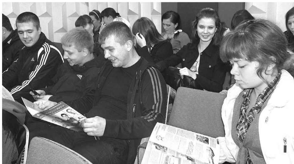
Учащиеся Богдановичского политехникума заинтересовал учебник Пенсионного фонда.

Учащиеся политехникума поначалу скептически отнеслись к этой встрече – до пенсии им еще