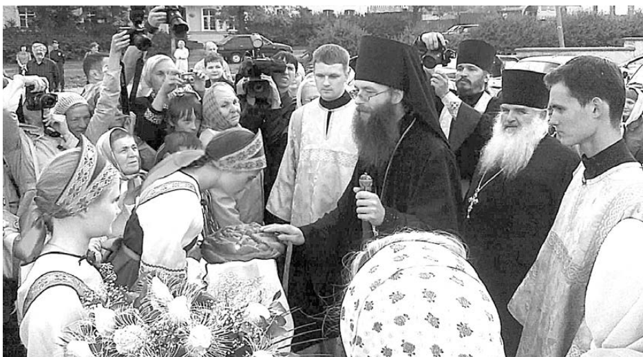
На встречу с епископом Каменским и Алапаевским пришло много верующих.

9 сентября 2011 года духовенство городского округа Богданович, Сухого Лога, Камышлова, Асбеста и остальных приходов, вошед-