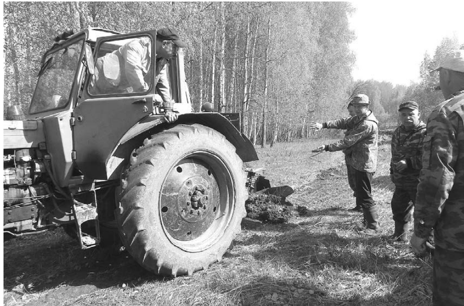
Работники Богдановичского участкового лесничества и Сухоложского лесхоза на создании минполос.