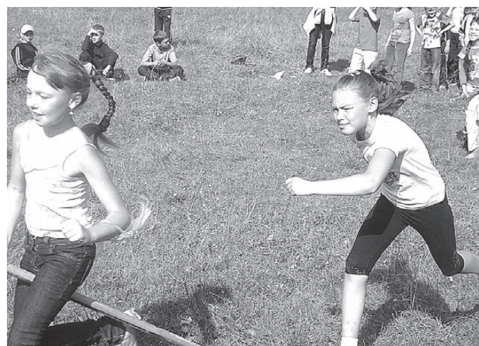
Ученикам школы № 3 на турслете было не до скуки.

Хочется выразить благодарность всем, кто принимал участие в организации тури-