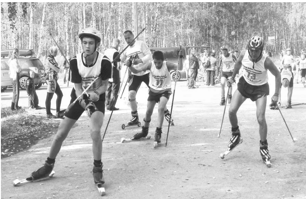
Третий этап триатлона — пять км на лыжероллерах.