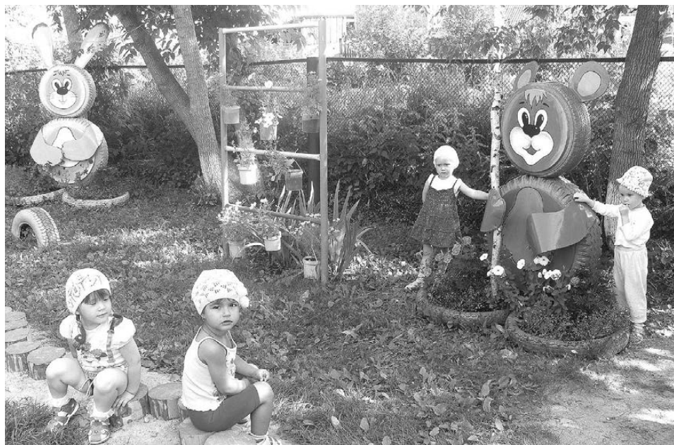
На участке второй младшей группы Тыгшского детсада сказочные герои радуют детей.