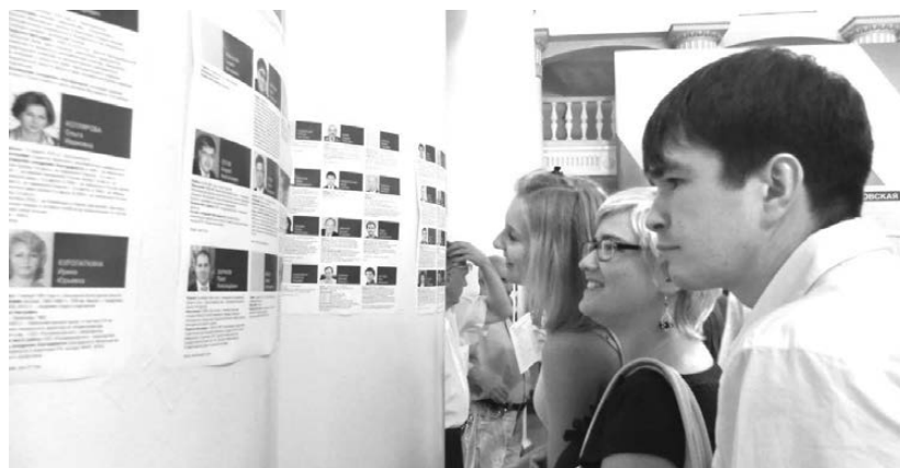
Выборщики знакомятся со списками кандидатов в депутаты.

Мероприятие началось с их выступлений. Каждому отводилось на выступление шесть минут. Затем