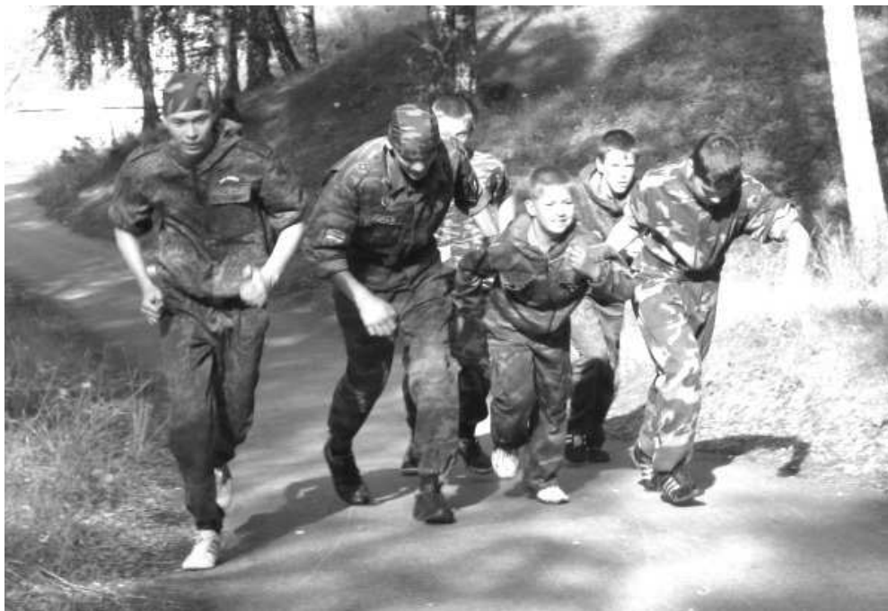
Юные бойцы на сборах проходят курс выживания, предназначенный для солдат ВДВ.

В этом году в первый же день военно-спортивных сборов «Спецназ-юниор» начались испытания, в то время как ребята даже не успели заехать в лагерь и обустроить его. Зарядил