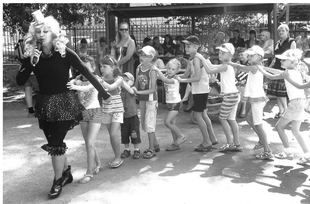
На дне рождения парка дети веселились и играли.