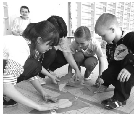
Команда «Земляне» собирает бумажную ракету.

Так как слет был посвящен Дню космонавтики, то и все испытания были на эту тему. Например, в конкурсе на смекалку и реакцию звучали такие вопросы, как «Какой самый быстрый вид транспорта?», «Кто был первой женщиной-космонавтом?» и другие. Увлекательным конкурсом для участников стала и