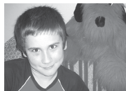
Саше 12-й год. У него развитое воображение, богатая фантазия, художественный стиль восприятия мира.

Подробную информацию можно получить по телефону — 2-48-08.