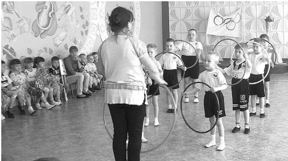
Каждые пять дней Олимпиады воспитанники детсада № 15 состязались в скорости, меткости и выносливости. На снимке команда «Рваный кед».

Пять дней дети соревновались и выясняли: кто лучший в кроссе, в прыжках в длину, в метании и в других спортивных состязаниях.