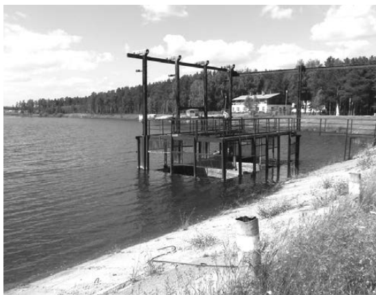
Паршинский пруд – излюбленное место отдыха богдановичцев.