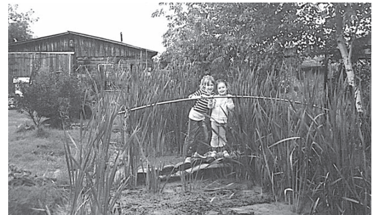
Пруд с камышами – любимое место игр внуков Аптиных.

и большой теплице, дающей щедрый урожай... Цветы же на участке Аптиных благоухают все лето, даря хозяевам только хорошее настроение.