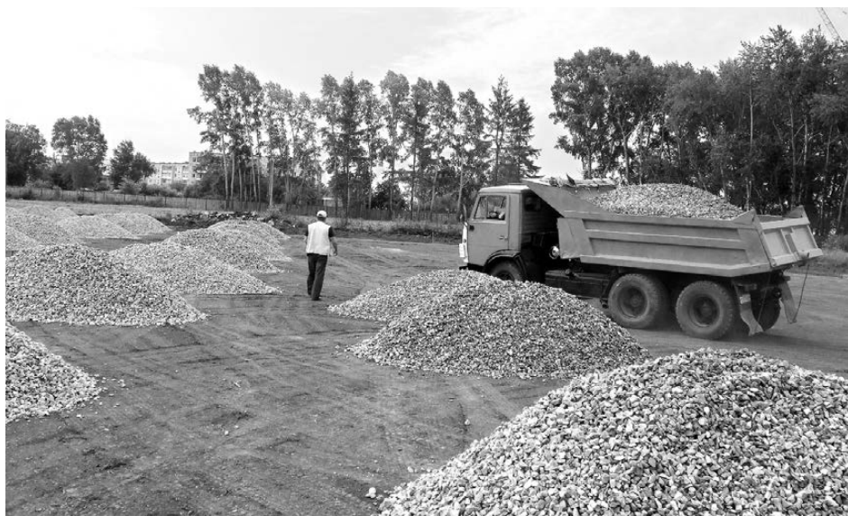
МУП «Благоустройство» завозит щебень на будущее футбольное поле.