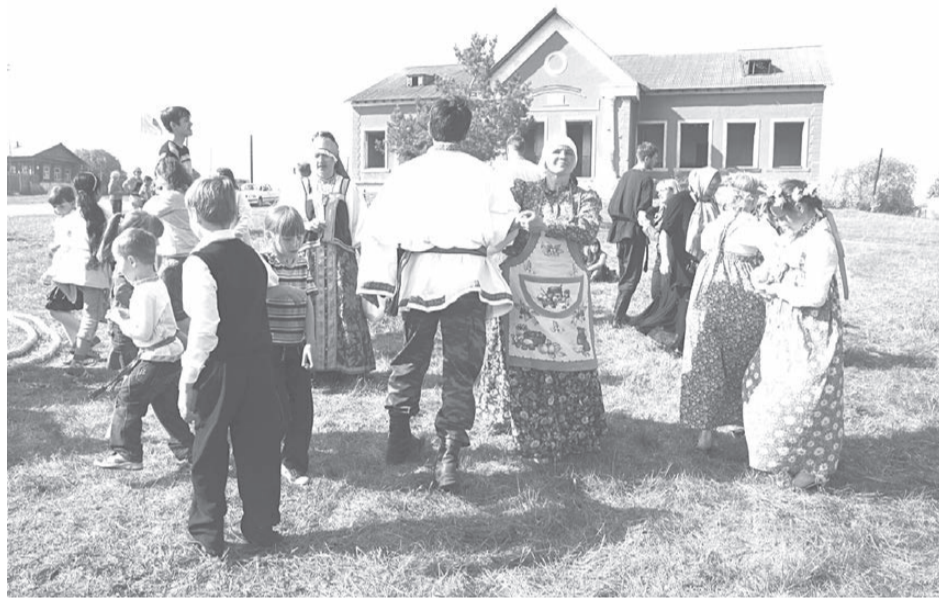
Плясать веселую кадрили молодое поколение научилось быстро.

В. ХУДОРОЖКОВ, директор Фонда восстановления и строительства православных храмов «Возрождение Православных Святынь Земли Русской».