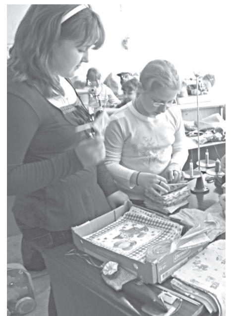
Швейная мастерская лагеря при школе № 2 презентовала на мероприятии шитье своими руками изделия.