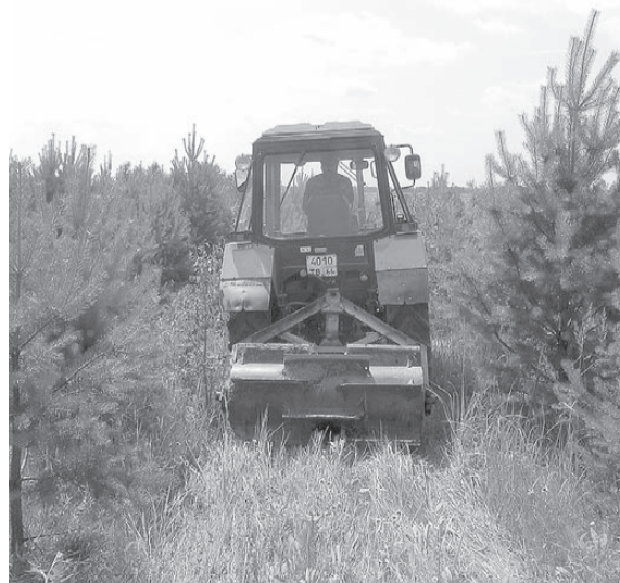
Ведется механизированный уход за лесными культурами.