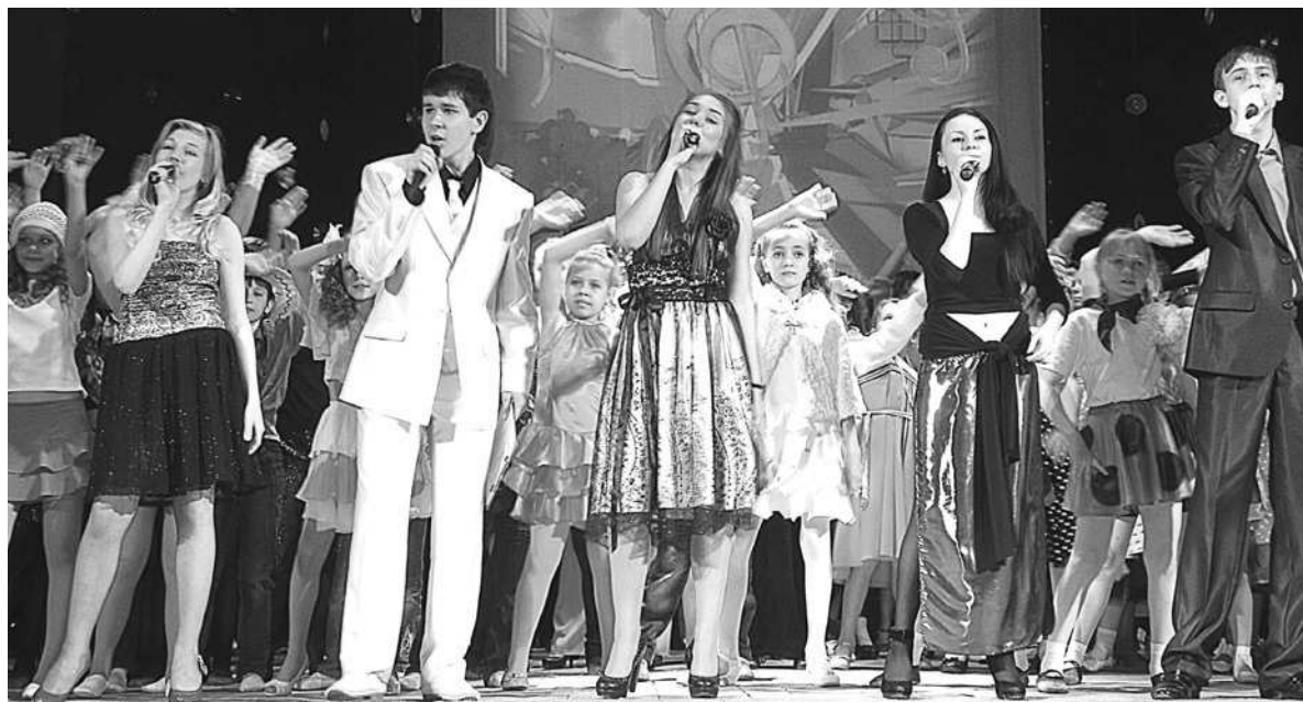
Фестиваль «Успех» объединил всех талантливых детей нашего округа.