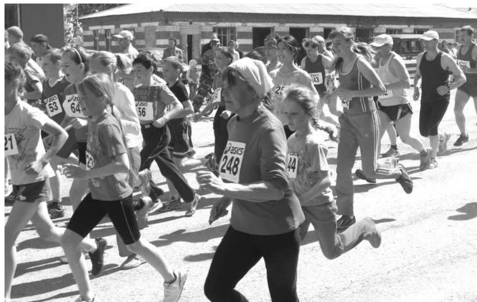
Участники легкоатлетического пробега стартовали одновременно, независимо от возраста.