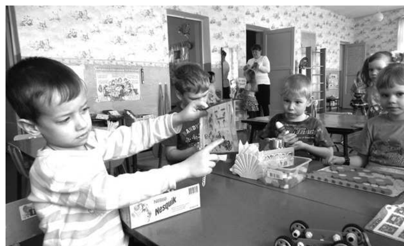
В Ильинском детском саду планируется открытие второй группы.