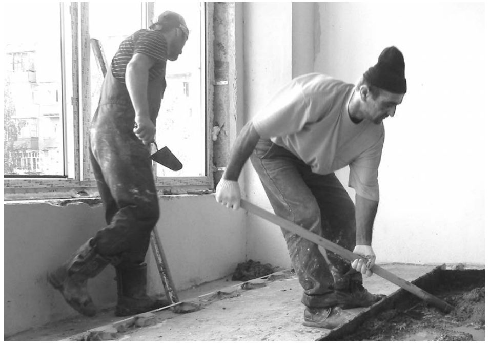
Строители ООО «Строймонтаж Урал-2000» выполняют стяжку пола.