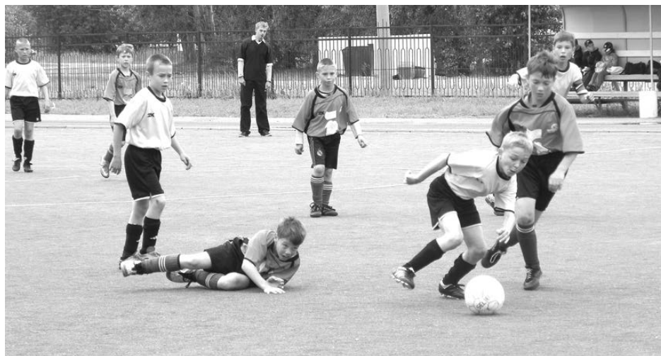
Момент финальной игры команды «Удача» (Каменск-Уральский) с «Сигналом» (Артемовский).