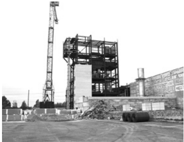
Пуск завода по производству теплоизоляционных плит на основе базальтового волокна.