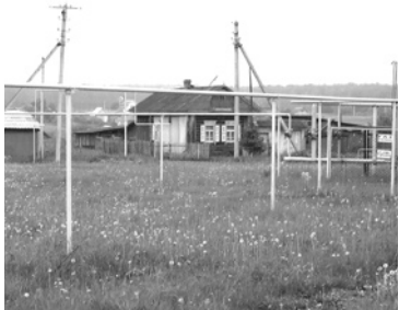
Строительство наружных газопроводов протяженностью 21,4 км.