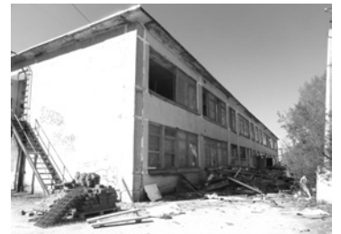
Восстановление детского сада № 38 на 90 мест.