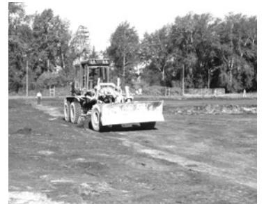
Ввод в эксплуатацию футбольного стадиона с искусственным покрытием на ул. Парковой, 10, в г. Богдановиче.