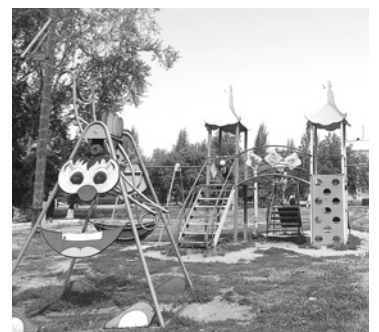
Строительство 4-х дворовых площадок по губернаторской программе «1000 благоустроенных дворов» на 2011–2015 гг.