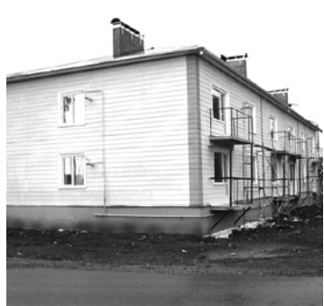
Ввод в эксплуатацию 12-квартирного дома в п. Полдневом (снос последнего барака).