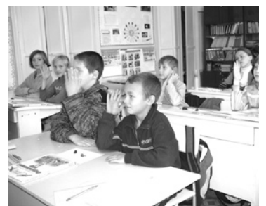
Ремонт Троицкой средней общеобразовательной школы.