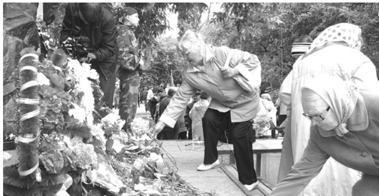
Возложение цветов у монумента погибшим воинам-землякам у ТЦ «Спутник».