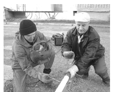
Строительство водопровода для подключения с. Коменки к системе водоснабжения г. Богдановича (3 км).