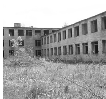
Реконструкция здания водогрязелечебницы под детский сад на 90 мест.