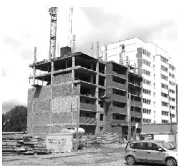
Ввод в эксплуатацию 83-квартирного дома на ул. Кунавина в г. Богдановиче.

Ежегодно администрация нашего городского округа разрабатывает программу социально-экономического развития. И по итогам каждого квартала регулярно публикует отчет о выполнении этой программы.