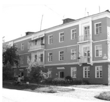
Капитальный ремонт многоквартирных домов по 185-ФЗ на сумму 50 млн рублей.