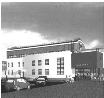
Начало строительства бассейна – вторая очередь многофункционального спортивного центра.