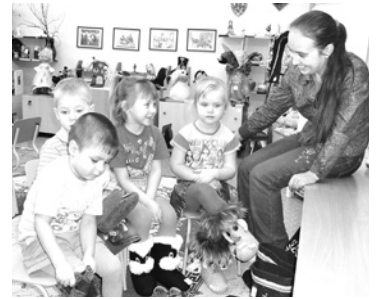
Выполнение проектных работ по строительству детского сада на 135 мест с вводом в эксплуатацию в 2012 году и предпроектная подготовка по детскому саду на 270 мест.

Когда руководство муниципалитета всерьез озабочено будущим территории, если оно хочет и может отстаивать ее интересы, оно найдет поддержку властных институтов и может рассчитывать на реальный успех.