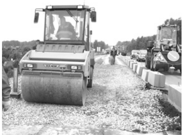
Реконструкция автомобильной дороги по улице Кунавина в г. Богдановиче.