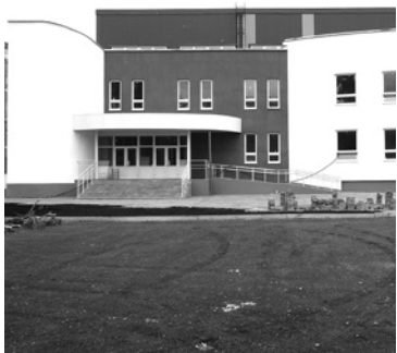
Ввод в эксплуатацию первой очереди многофункционального спортивного центра.