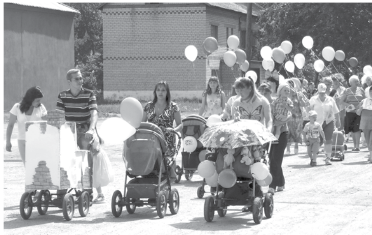
Праздничное шествие в Коменках открыли новорожденные в колясках.